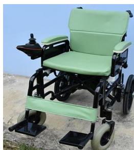
รูปรถเข็นนั่งใช้ไฟฟ้า รุ่น KM

บริษัทฯ รับประกันรถเข็นนั่งใช้ไฟฟ้าเป็นเวลา 1 ปี รวมค่าบำรุงรักษา และซ่อมแซมแก้ไข